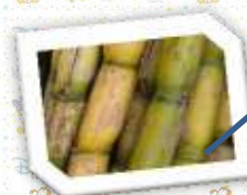
อ้อยโรงงาน

ผลิตที่สำคัญในกลุ่มภาคกลางตอนบน 2 ได้แก่ จังหวัดลพบุรี ชัยนาท อยู่ในช่วงเก็บเกี่ยวผลผลิต สถานการณ์ทางด้านราคาหัวมันสำปะหลังสด ละเอียดปรับตัวสูงขึ้น โดยราคาที่เกษตรกรขายได้ จังหวัดชัยนาท กก.ละ 2.35 บาท จังหวัดลพบุรี กก.ละ 2.13 บาท