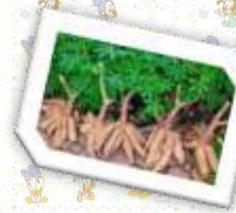
มันสำปะหลังโรงงาน